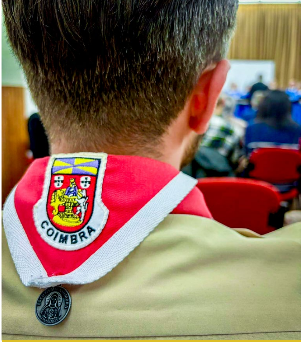
CNE Região de Coimbra

E depois eu gostava muito que a diocese olhasse para o escutismo de uma forma cooperativa, não nos verem como um movimento de fora, mas verem-nos como parte.