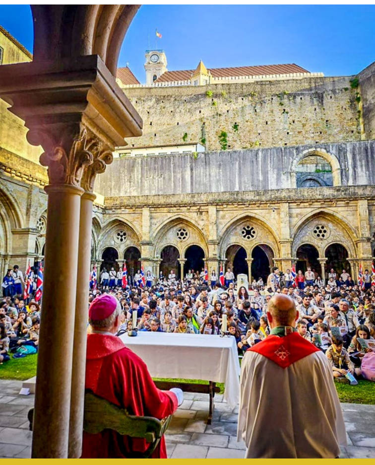
Primeira iniciativa do centenário

Já começámos na Sé Velha, assinalando o início das comemorações e com o lançamento da imagem do centenário. Depois, o ponto alto será o Acampamento Regional (Jamboree das Beiras) em julho de 2026, em São Gião (Oliveira do Hospital). Vamos acampar na "Catedral das Beiras" com escuteiros de vários países, dado que a paróquia se insere no território da diocese da Guarda, estão convidados os dois bispos, de Coimbra e da Guarda, a estarem connosco.