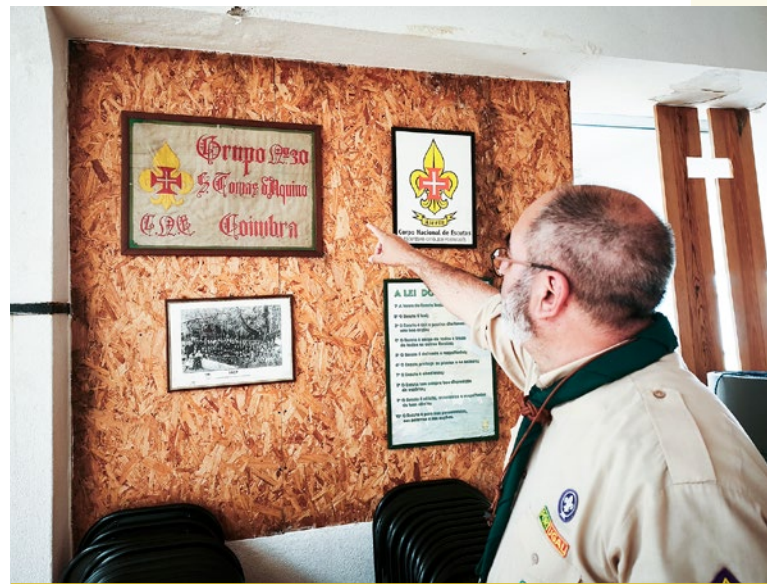
O primeiro grupo, o 30 de São Tomás de Aquino

E depois temos em outubro, no dia 15 de outubro, uma deliberação da Junta Central a dizer que a Junta Regional de Coimbra estava criada.