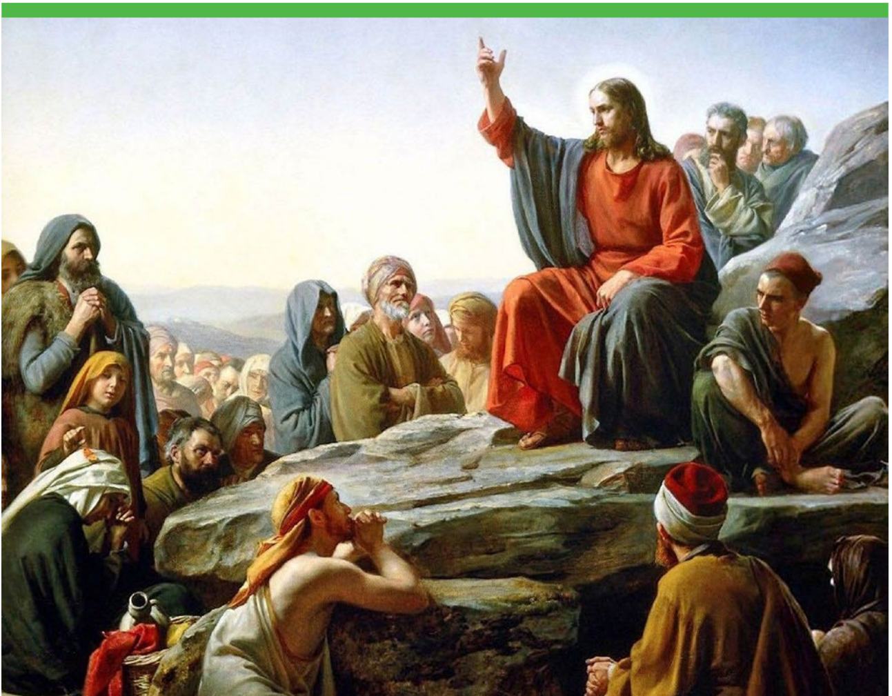
Sermão na Montanha, uma pintura de Carl Bloch de 1877.

Peçamos a Jesus Cristo a graça de amarmos muito e de sermos sempre instrumentos de vida e não de morte, de união e não de divisão, testemunhas da verdade e não da incerteza ou da mentira. 🙏