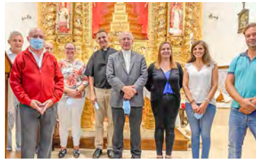
Visita à comunidade de S. Martinho da Cortiça