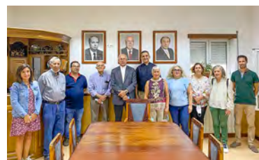
Visita ao Centro Social e Paroquial do Sarzedo

Desejamos que as bênçãos e luz de Deus nunca lhe faltem, para que a sua presença seja luz no caminho de todos.