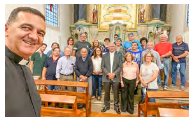
Visita à comunidade do Sarzedo