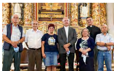
Visita à comunidade de Folques