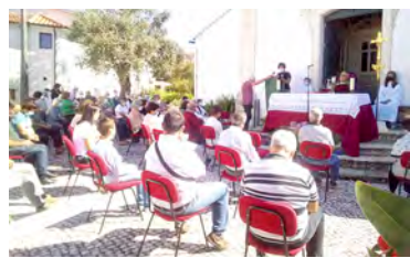
Celebração da Eucaristia frente à Igreja. Na foto vemos uma parte da assembleia

Embora S. Sebastião não seja o padroeiro da Paróquia de S. João Baptista de Brasfemes, no entanto a Paróquia não quis esquecer este acontecimento anual e homenageou o mártir santo no passado domingo.